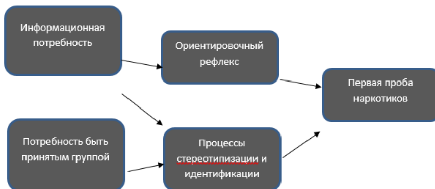
Рис. 3. Механизм возникновения мотивов, побуждающих к первой наркотической пробе

Первичная профилактика, ориентированная на подростков, должна содержать в себе не только элементы адекватной интеракции между подростками и взрослыми, но и привносить в жизнь первых важные практические копинг-навыки [Симатова, 2012]. Любая первичная профилактика должна быть по своей сути комплексной, всеохватывающей и актуальной по содержанию. Также она должна работать на опережение и носить конструктивно-позитивный характер [Осипова, Астахова, Солтовец, 1998].