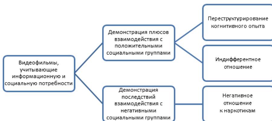
Рис. 4. Схема синергетического взаимодействия факторов предотвращения первой наркотической пробы

Обобщая все вышесказанное, целесообразно проиллюстрировать предлагаемый профилактический концепт (рис. 4). Видеофильмы как инструмент, конвертирующий несколько способов подачи информации, позволяют удовлетворить интерес подростков к теме наркотиков и интегрировать в их среду актуальные знания, помочь осмысленно их усвоить за счет групповых дискуссий и ролевых игр.