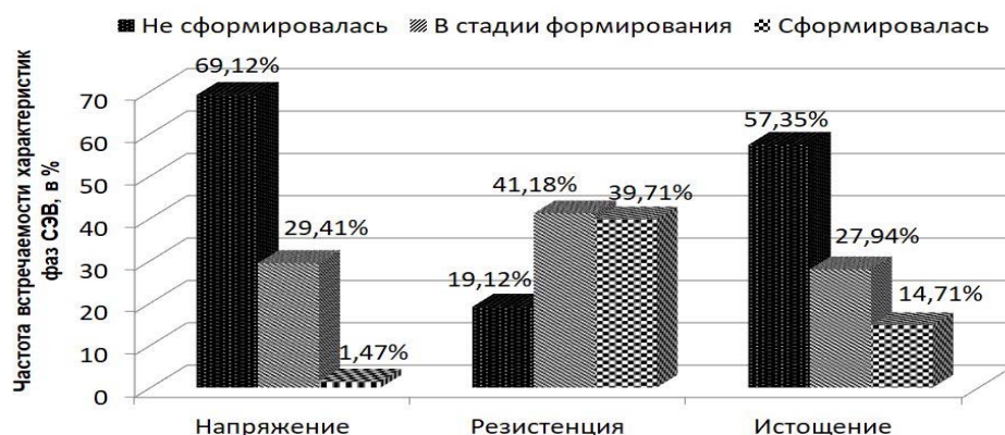
Рис. 2. Оценка частоты встречаемости характеристик фаз СЭВ у ординаторов ( n = 68 )

Проведенный анализ эмпирических данных позволил оценить уровень проявления следующих признаков, характерных для фазы «истощение»: ЭД в 13,3 % случаев, ЭО и ЛО – по 7,4 % случаев соответственно и ПиПВН – в 4,4 % случаев. Сложившиеся симптомы наблюдались: ЭД и ЭО – в 11,8 % случаев, ЛО – в 5,9 и ПиПВН – в 10,3. Складывающийся симптом отмечен следующим образом: ЭО – в 42,7, ЭД – в 30,9, ЛО – в 26,5 % и ПиПВН – в 14,7 % случаев. При оценке несложившегося симптома выявлено преобладание ПиПВН в 70,6, ЛО – в 60,3, ЭД – в 44,1 и ЭО – в 38,2 % случаев. Если суммировать процентные показатели доминирующих и сложившихся симптомов, то обнаружится преобладание распространенности ЭД (25,0 %) над ЛО (13,2 %) в 1,9 раза, над ПиПВН (14,7 %) – в 1,7 раза, над ЭО (19,1 %) – в 1,3 раза, что свидетельствует о выраженном вкладе эмоционального характера истощения в развитие СЭВ.