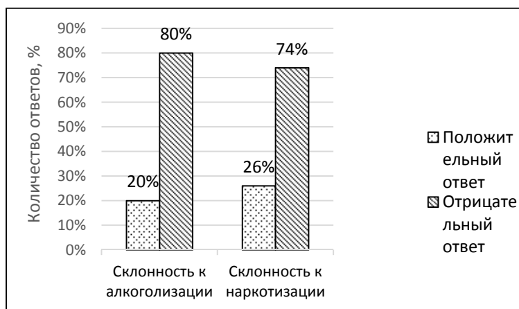
Рис. 2. Результаты ответов для выявления формы наркотизма

Получены интересные, но противоречивые данные: показатели вербальной агрессии и чувства вины у испытуемых превышают норму. Мы полагаем, что при сравнении себя со сверстниками подросток даже со сниженным интеллектом замечает, что по многим качествам он проигрывает сверстникам, что не позволяет ему встать наравне с ними. Реакция агрессии в таком случае носит характер психологической защиты, позволяя хоть в чем-то утвердиться перед сверстниками. Чувство вины на уровне выше среднего говорит о сохранности морально-нравственной сферы, которая выполняет функцию сдерживания агрессии, к сожалению, после совершения агрессивных действий. Эта особенность позволяет выстраивать работу с подростками со сниженным интеллектом по социализации и социальной адаптации.