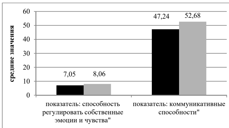
Рис. 3. Средние значения показателей поведенческого компонента социального интеллекта по методикам № 5, 6: черный цвет – мальчики, серый цвет – девочки

По средним значениям показателей поведенческого компонента социального интеллекта мы зафиксировали их явную выраженность у девочек по сравнению с мальчиками (рис. 3).