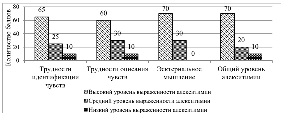
Рис. 1. Выраженность проявлений алекситимии у женщин с компульсивным перееданием, %

Опираясь на взгляды Л. Хатфорда и Д. Эванса о том, что женщинам с компульсивным перееданием при воздействии стресса характерно использование малоадаптивных копинг-стратегий, таких как избегание и проявление нежелания обсуждать свои проблемы с окружающими, мы изучили соотношение копинг-стратегий с уровнем выраженности алекситимии у женщин с компульсивным перееданием (табл.).